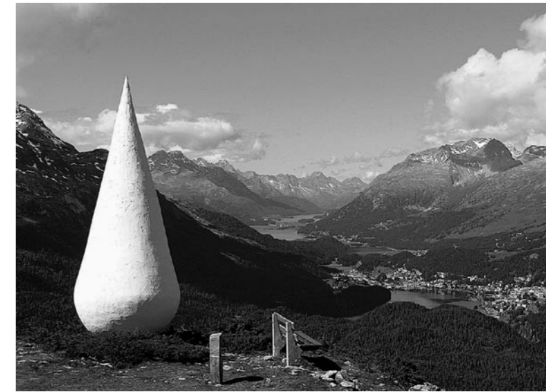
„Vorwärts, aber anders als bisher.“