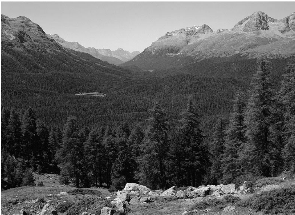
So könnte das Oberengadin im Naturzustand etwa gewesen sein. Heute nähern wir uns dem anderen Extrem.