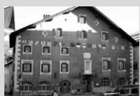
Hotel Crusch Alva, Zuoz Unmittelbar nach ihrer Gründung wurde die Stiftung

Terrafina auf die drohende Umwidmung des traditionellen Hotels am Zuoz Dorfplatz aufmerksam. Sie machte am 7. November 2003 ihre Einwände beim Gemeindevorstand von Zuoz geltend und konnte mit Gleichgesinnten zum Bestand des Hotels beitragen. Als symbolische Geste hat die Stiftung eine Aktie des Hotels gezeichnet.